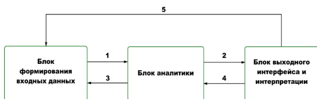
Рис. 4. Структурная схема системы, построенной по принципу референсной архитектуры.

Система, составленная из ряда независимых блоков и пригодная после переконфигурации для решения широкого круга задач, называется референсной. В данной работе предлагается использовать три блока: блок формирования данных (БФД), блок аналитики (БА) и блок выходного интерфейса и интерпретации (БИИ). Предложенная структура представлена на рисунке 4.