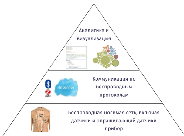
Рис. 1. Диаграмма построения носимой системы мониторинга состояния здоровья человека.

Аппаратный слой НСМЗ является ключевым, так как он отвечает за формирование данных для анализа. В системах [7, 10, 11] представлены различные вариации с разным количеством сенсоров (температура, электрокардиограмма, положение тела в пространстве и т. д.). Также стоит отметить, что с развитием микроэлектроники количество доступных датчиков растет, и при проектировании данного слоя необходимо учитывать совместимость старых сенсоров с новыми. Из [7, 10, 11] видно, что коммуникационный слой имплементируется через центральную плату, которая напрямую соединена с сенсорами, и с помощью беспроводных технологий осуществляется передача данных на удаленный сервер. При проектировании коммуникационного слоя важно учитывать методики хранения данных, поскольку длительное время передачи существенно увеличивает время работы всей НСМЗ. Поскольку данные передаются беспроводным способом, весь анализ проводится удаленно; в [7, 10, 11] слой аналитики развернут в облачном хранилище, которое позволяет постоянно расширять базу записанных сигналов.